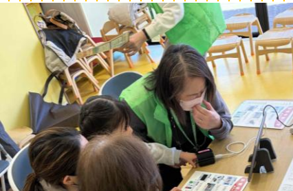
保健活動推進委員の皆さんによる健康 チェック! 皆さん、いかがでしたか?