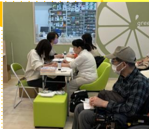
お菓子釣り・ハンドマッサージ