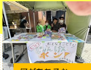
何が当たるか じゃんけんポン!