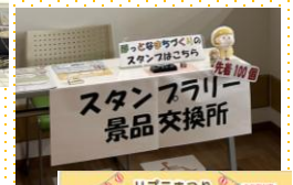
スタンフラリー 景品交換所