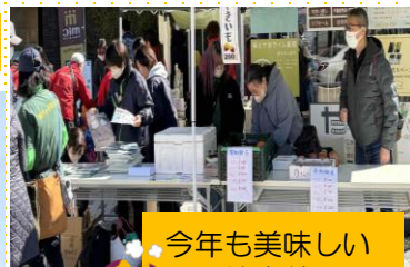
今年も美味しい 焼き芋