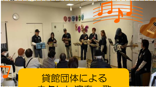
貸館団体による ウクレレ演奏・歌