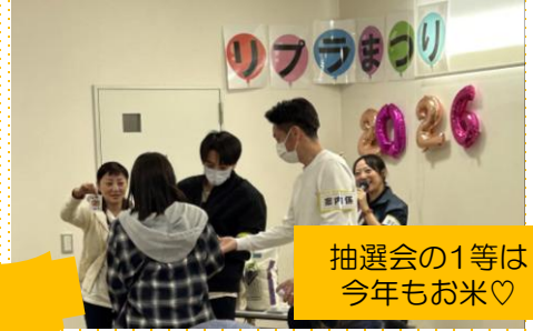
抽選会の1等は 今年もお米♡