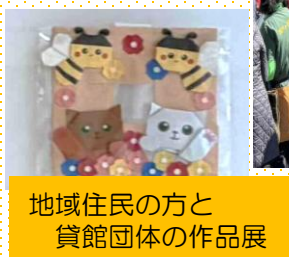
地域住民の方と 貸館団体の作品展