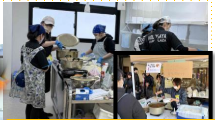
隠し味の入ったカレーライス!